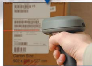
Escaneador de Código de Barras